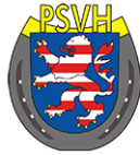
PFERDESportverband HESSEN E.V.